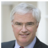
Carl DECALUWÉ De Gouverneur van West-Vlaanderen