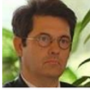
Georges-François LECLERC Préfet de région