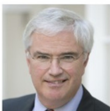
De Gouverneur van West-Vlaanderen Carl Decaluwé